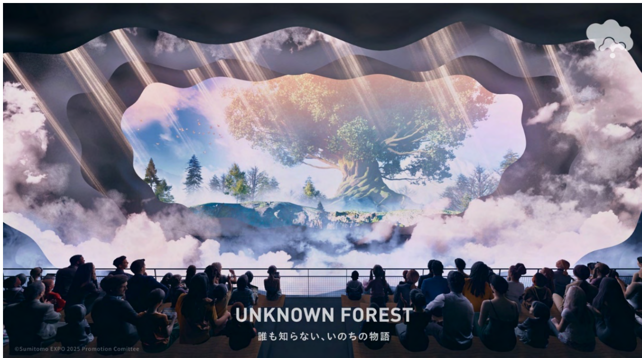
風や霧が漂う、およそ幅 20m×高さ 7.5mの「パフォーミングシアター」

森を巡る体験を終え、来場者の前に現れるのはおよそ幅 20m×高さ 7.5mの「パフォーミングシアター」。空間に漂う風や霧が来場者の感覚を揺さぶり、複層の映像スクリーンと音楽・人が融合する大迫力の演出で UNKNOWN FOREST のクライマックスを迎えます。