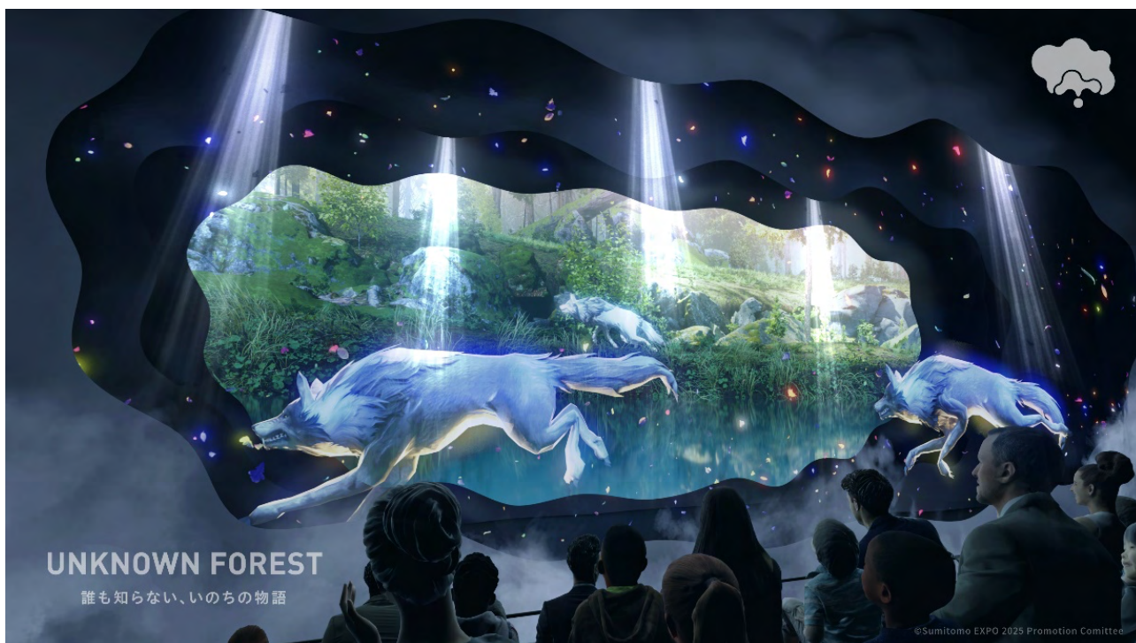
複層の映像スクリーンを用いた映像・音楽・人が融合した幻想的で大迫力の演出が展開される