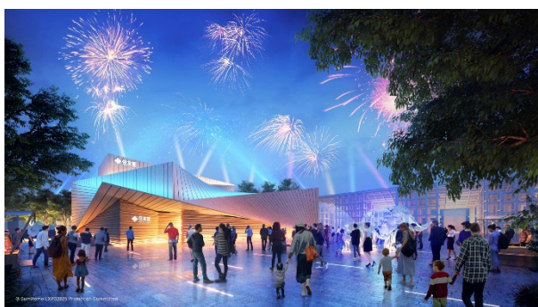
住友館 建築外観デザイン

パビリオンの建設にあたっては、住友グループが保有する“住友の森”の木を全面的に活用します。私たちは「 1本1本のいのちを大切にしたい 」という思いから、木材の加工方法に関しても検討と議論を重ね、“合板”を用いる事で木々を余すことなく利用します。木材を薄く桂剥きにすることで合板へと加工し、さらに桂剥き後に残った“芯”も、ベンチなどに姿を変えて住友館に設置します。