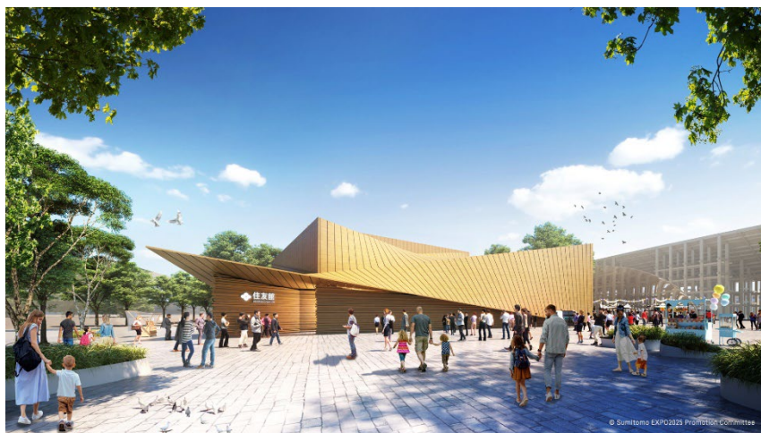
住友館 建築外観デザイン

未来を担う子どもたちやみなさまが植林した木々が、数十年後、100年後、時を超えて、未来へと脈々と受け継がれていく。過去から受け継がれてきた木々に触れる。ここにしかない森の中で“いのちの物語”と出会う。住友館で過ごす時間が原体験となって、森や自然と向き合い、未来へ想いを馳せる大切さを感じ続けるきっかけをこのパビリオンで提供します。